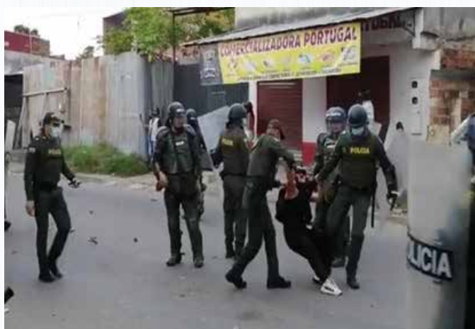
BLU RADIO. (2021) 10

Estas agresiones no han dado tregua, y se ha presentado de manera recurrente, desproporcionada, innecesaria e ilegal, en medio de detenciones. En mayo de 2021, un hombre fue golpeado por varios agentes en el municipio de Lebrija, incluso cuando ya había sido esposado y se encontraba bajo control de los agentes 7 ; un segundo caso se presentó en diciembre de 2021 en el municipio de Ocaña, cuando un hombre que se movilizaba en motocicleta pasó por inmediaciones de un lugar donde se llevaba a cabo un procedimiento policial, el hombre intentó esquivar a los agentes, pero luego recibió una pedrada en la cabeza (lanzada por un policía) que lo obligó a detenerse, en ese momento el grupo de agentes lo golpeó brutalmente, y días después falleció a causa de las lesiones 8 ; también, en junio de 2023 en el municipio de Floridablanca, un joven fue brutalmente golpeado por un agente de la Policía al momento de su captura, aún cuando no estaba ejerciendo resistencia al procedimiento 9 .